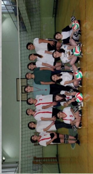
Volleyball Jugendsportschule, JG 2008-2009