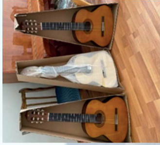
Chartar Art School