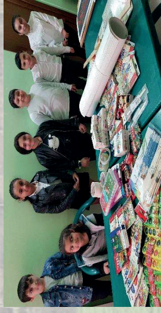
Hadrout Art School, Stepanakert