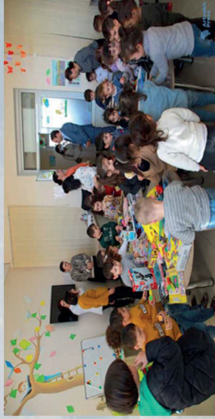
Kindergarten Dizak, Stepanakert