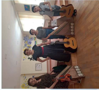
Askeran Art School