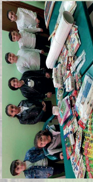
Hadrout Art School, Stepanakert